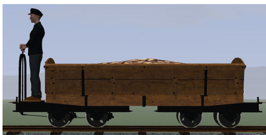
Rübenwagen, Lorenfw., gebremst, Eiche dunkel (Dateiname: R_Wg_Br_E_KK1 – enthalten in: V11NKK10085)