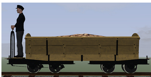
Rübenwagen, Lorenfw., gebremst, Eiche hell (Dateiname: R_Wg_Br_hell_KK1 – enthalten in: V11NKK10085)