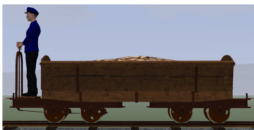
Rübenwagen, Lorenfw., gebremst, Eiche dunkel Rost (Dateiname: R_Wg_Br_ER_KK1 – enthalten in: V11NKK10085)