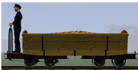
Rübenwagen, Lorenfw., gebremst, Eiche hell 2 (Dateiname: R_Wg_Br_hell2_KK1 – enthalten in: V11NKK10085)