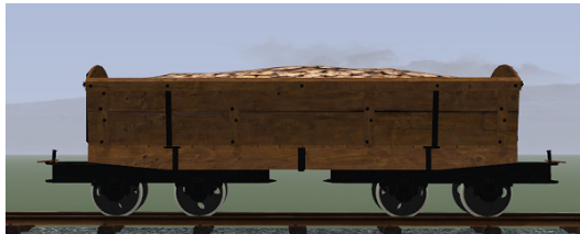
Rübenwagen, Lorenfw., Eiche dunkel (Dateiname: R_Wg_E_KK1 – enthalten in: V11NKK10085)