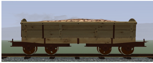
Rübenwagen, Lorenfw., Fichte Rost (Dateiname: R_Wg_FR_KK1 – enthalten in: V11NKK10085)