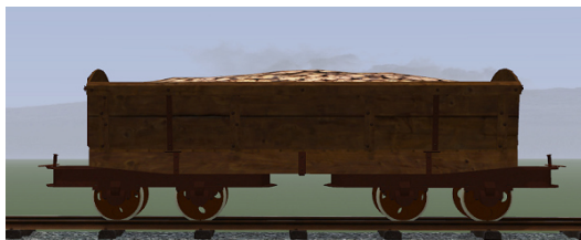
Rübenwagen, Lorenfw., Eiche dunkel Rost (Dateiname: R_Wg_ER_KK1 – enthalten in: V11NKK10085)