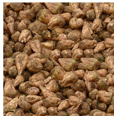
Zuckerrueben_KK1.png (vom Ostermodell 2018)

Die gebremsten Wagen haben jeweils einen Bremser, der per Schieberegler, Kontaktpunkt oder LUA eingblendet werden kann. Die Männer haben unterschiedliche Gesichter und kleinere Farbunterschiede bei der Kleidung.