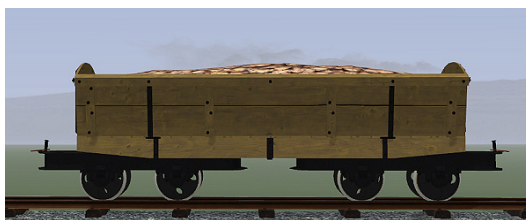
Rübenwagen, Lorenfw., Eiche hell (Dateiname: R_Wg_hell_KK1 – enthalten in: V11NKK10085)