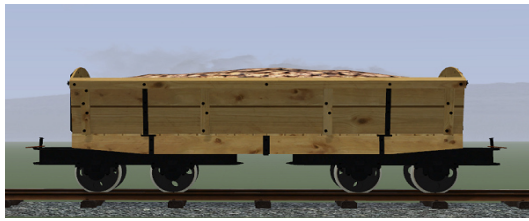
Rübenwagen, Lorenfw., Fichte (Dateiname: R_Wg_F_KK1 – enthalten in: V11NKK10085)