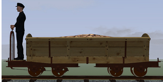
Rübenwagen, Lorenfw., gebremst, Fichte Rost (Dateiname: R_Wg_Br_FR_KK1 – enthalten in: V11NKK10085)