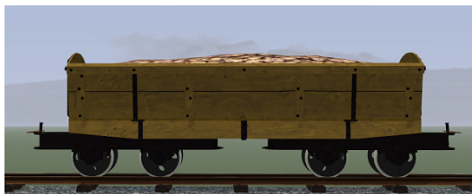
Rübenwagen, Lorenfw., Eiche hell 2 (Dateiname: R_Wg_hell2_KK1 – enthalten in: V11NKK10085)