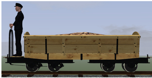
Rübenwagen, Lorenfw., gebremst, Fichte (Dateiname: R_Wg_Br_F_KK1 – enthalten in: V11NKK10085)