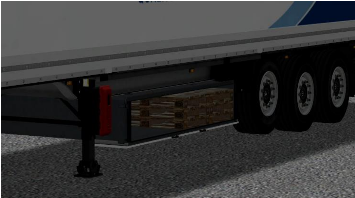
Palettenkasten geöffnet ( Klappe_li, Klappe_re)