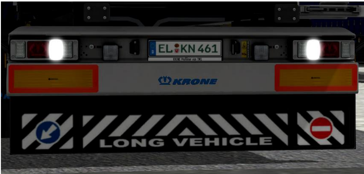
Rückfahrleuchten an (Rueckfahren)