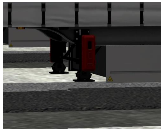
Stützen oben (Stuetzen)