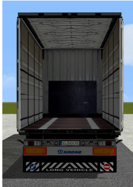
ohne Ladung (Ladung)