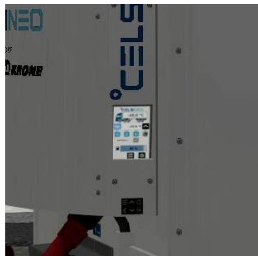
Kühlaggreat an (Kühlaggreat _an_ aus)