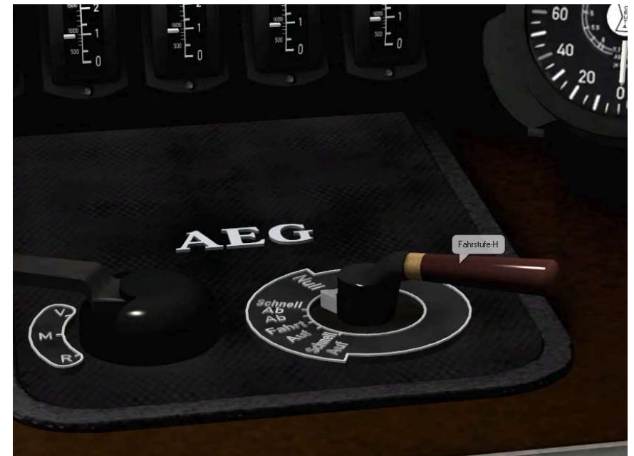
Bsp. Tiptext „Fahrstufe-H“

14 Wahlhebel für Kompressor – nur im vorderen Führerstand mit Animation